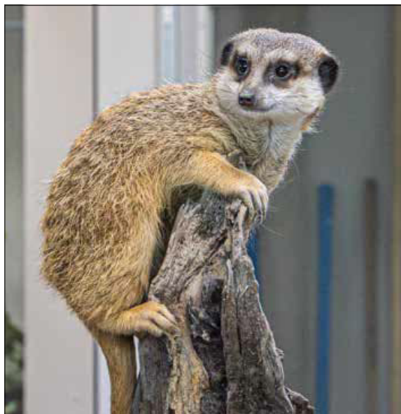
Immer auf Zack: Die Erdmännchen haben ihr neues Gehege im Sturm erobert. Gestaltet wurde es im „Kalahari-Look“: mit rötlichen Steinen und Termitenhügeln.

kann als Ganzes genutzt oder dank flexibler Torsysteme in Abteile getrennt werden. Die Tore sind von einem sicheren Raum aus zu bedienen; das schützt die Tierpflegerinnen und -pfleger etwa während der Brunft, wenn die Tiere gefährlich werden können. Alle Durchlässe sind drei Meter hoch, damit die Vögel gefahrlos hindurchschreiten können.